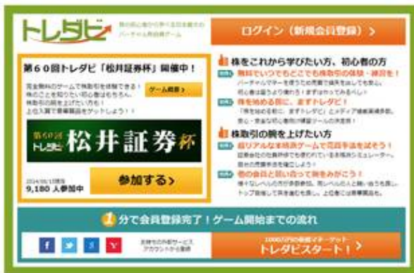
「トレダビ」サイト画面