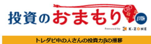
トレダビ中の人さんの投資カβの推移